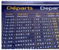
Vol Bâle/Mulhouse - Saint-Petersbourg A/R à partir de 203,00 €