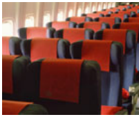
Vol Bâle/Mulhouse - Abidjan A/R à partir de 501,00 €