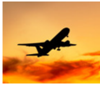
Vol Strasbourg - Abidjan A/R à partir de 421,00 €