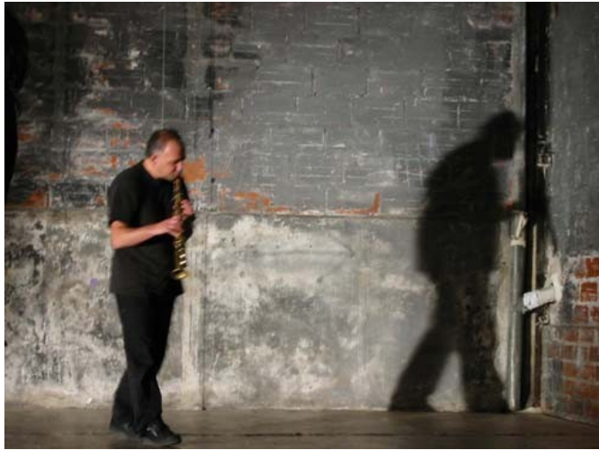
Illustration 1:

M. Doneda, saxophone soprano, né en 1954, est un musicien autodidacte.