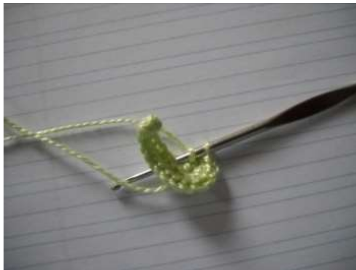
Départ de l'autre côté du montage