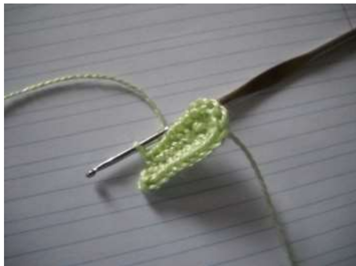
Fin du 1 er tour ou rang