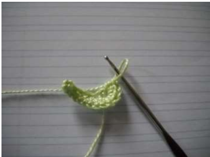
Fin de la 1 ère partie avec les 6 db