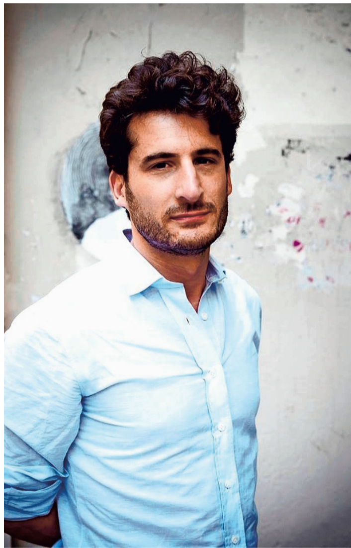
Emmanuel Ruben © DOC