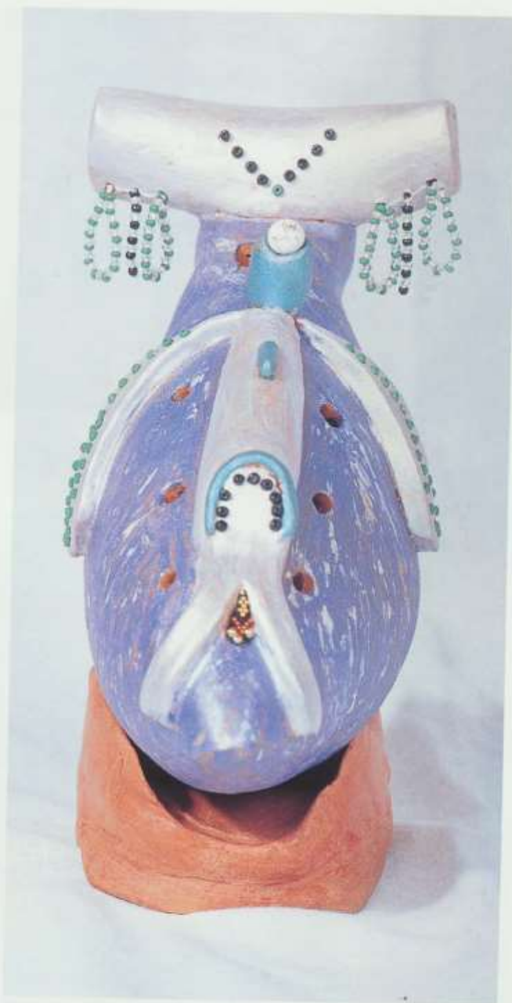
De face : la femme perlée peinte et décorée de perles.

N'hésitez pas à tester divers sons et à jouer sur la grandeur des trous. Vous pourrez toujours les reboucher si le son ne vous satisfait pas.