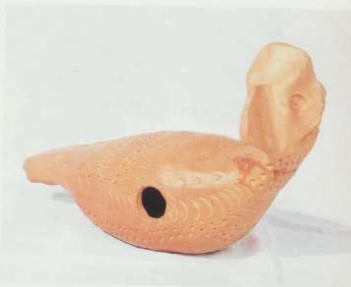
Instrument en terre brute.

Plutôt que de faire des trous n'importe où, il vaut mieux les faire adapter à ses mains et à ses doigts.