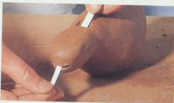
Passez une bandelette de papier pour éliminer les petits grains de terre.

Les finitions se font lorsque la terre est à la consistance du cuir. Travaillez à petits gestes précis avec la lime ou le cutter. Veillez à ce que les parois de la fenêtre soient le plus propre possible. Vous pouvez éventuellement les lisser avec la lime. L'extrémité du biseau doit être le plus net et le plus droit possible. Si ce n'est pas le cas, à l'aide du cutter, égalisez-le. Si des petits grains de terre sont dans le canal et perturbent le son, découpez une bandelette de papier un peu plus petite que la largeur de la fenêtre et passez-la dans le canal, dans le sens embouchure-fenêtre ce qui repoussera les grains de terre.