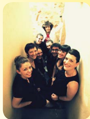
Voices and Co

C'est comme un rituel, chaque année, nous invitons plusieurs compagnies de la région dont le travail nous plaît. Nous fonctionnons au coup de cœur artistique et humain !