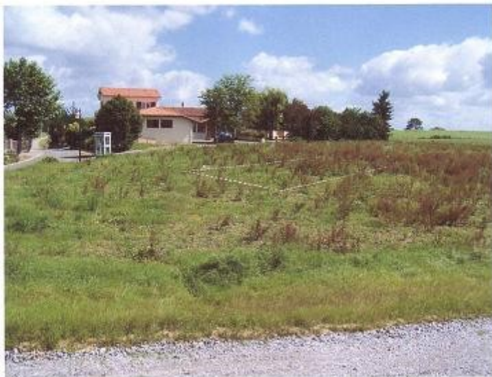
Photographie n° 1 de près du lieu de construction