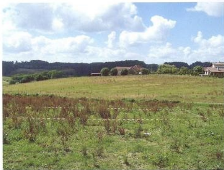
Photographie n° 2 de près du lieu de construction