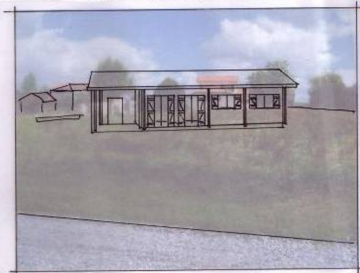
Photographie et document graphique