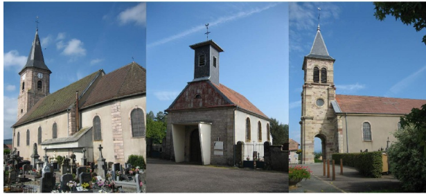
Lachapelle sous Chaux et Sermamagny (St Vincent) - Errevet (St Lin) - Evette-Salbert (St Claude)