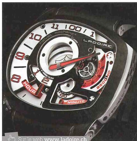
Sur le web www.ladoire.ch

Issu d'une famille bijoutière, à même de façonner, à partir de matière brute, un objet d'art, Lionel Ladoire s'égaré un peu vers les chemins d'une carrière professionnelle de pro rider et snowboarder de l'extrême. Sa première dose de rébellion, bercée de musique guerrière. Puis, l'envie de faire des montres, deuxième injection rebelle, l'amène à défendre le label swiss made bien au-delà de son pourcentage autorisé. Tout part de cette satanée volonté de faire exploser les cercles inhérents à toute lecture horaire convenue. Pour y parvenir, il fait développer durant plus de 2 ans son propre calibre. Il se sert d'une avancée technologique majeure de l'horlogerie, les miniroulements à billes en céramique développés par MPS, qui font l'économie de toute lubrification. Sous l'appellation Helvet Mechanic, somme toute assez underground, il sévit actuellement sous le slogan Rock Your Time avec sa série de Black Widows, montres ainsi nommées en référence à la vénéneuse Lacrodactes Mactans , seule araignée à occire son mâle, une fois sur deux, au sortir de ses actes copulateurs. Mr Race, passion rouge et noire.