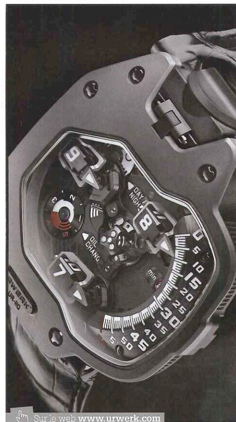
Sur le web www.urwerk.com