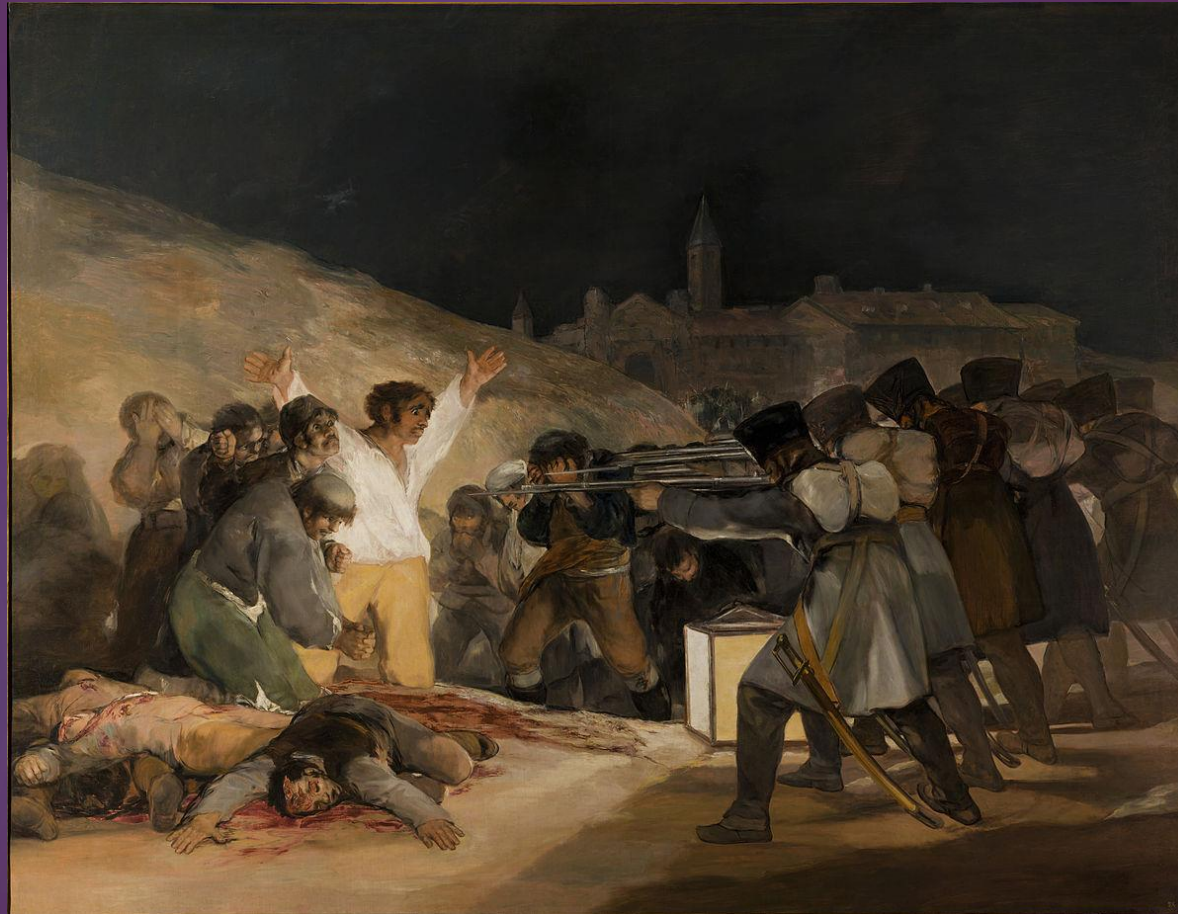
Francisco de Goya, Tres de Mayo