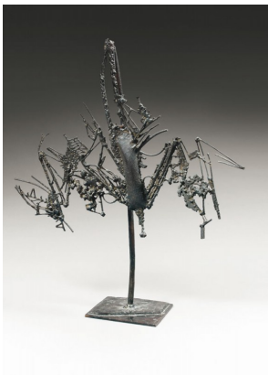
César 1955 chauve-souris