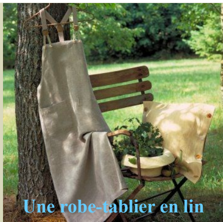
Une robe-tablier en lin

http://www.toutes-les-couleurs.com/couleur-bleu.php#nuances