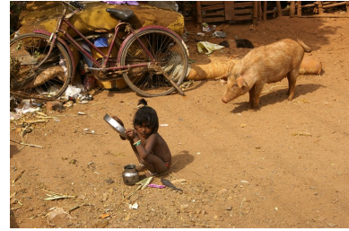
Une petite fille au milieu du bidonville