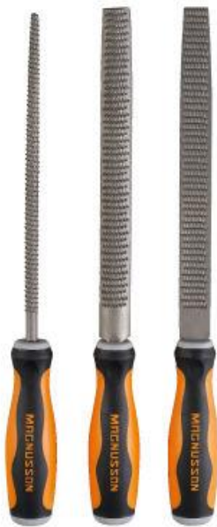
Limes de fabrication industrielle