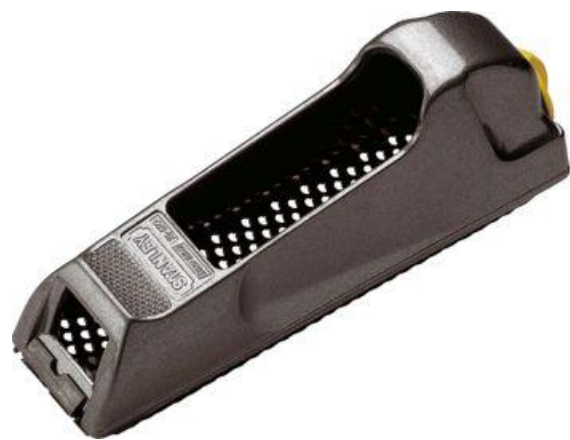
Râpe Stanley à lame échangeable