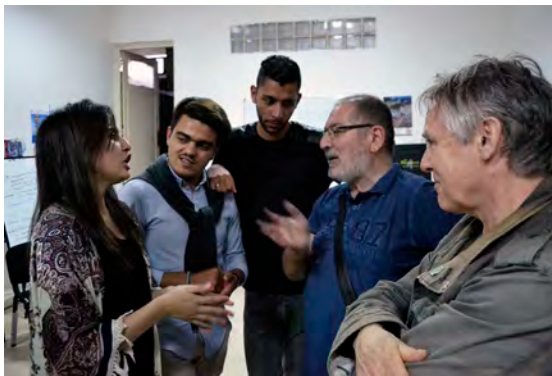
Échanges à Bel Horizon (Oran).