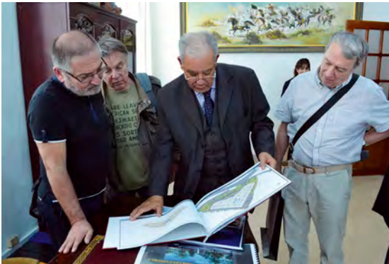
Le maire d'Oran et ses projets d'urbanisme.