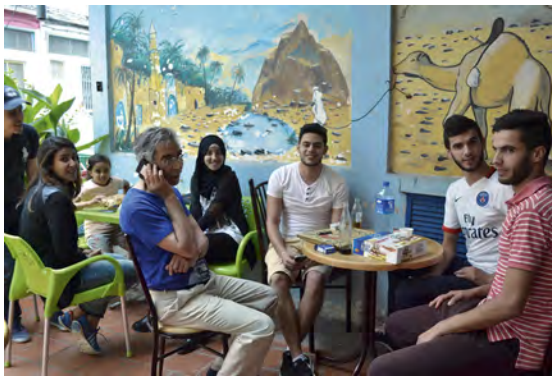
Les jeunes de Bel Horizon à Oran.