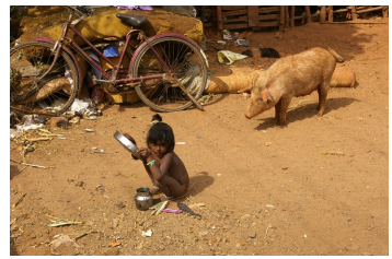
Une petite fille au milieu du bidonville