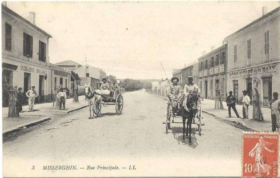
3 MISSEKGHIN. — Rue Principale.