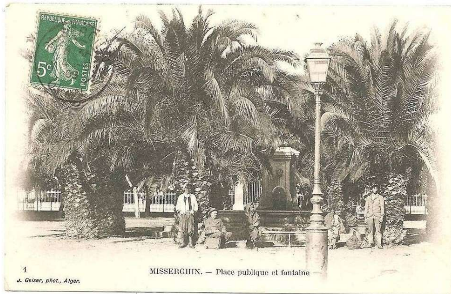
1 J. Geiser, phot., Alger.