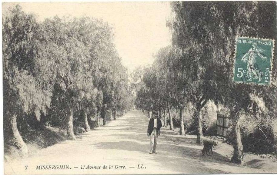
7 MISSEKGHIN. — L'Avenue de la Gare.