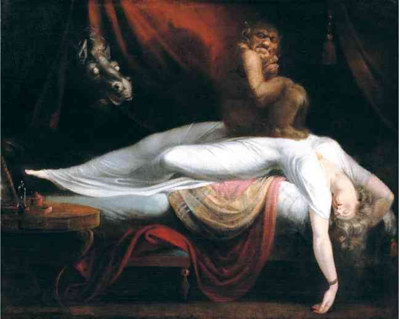
Henry Fuseli (1741-1825) Le Cauchemar , exposé à la Royal Academy en 1782 Huile sur toile - 101,6 x 126,7 cm Detroit, Institute of Art