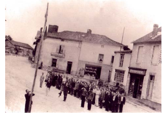
Foto: Izada de bandera del 643 GTE y llamamiento en la plaza de Oradour-sur Glane.