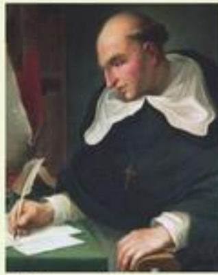
(Huile sur toile, anonyme, XVI e siècle, Séville, Espagne.)

1. Le travail forcé dans les mines ou sur les plantations.