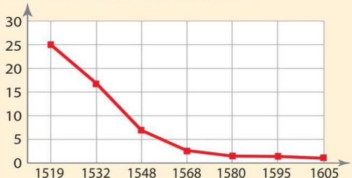
Millions d'habitants amérindiens

Les Espagnols exploitent l'or et l'argent qu'ils découvrent dans leurs colonies d'Amérique.