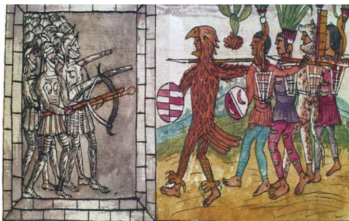
4 Les Espagnols face aux Aztèques (Codex Duran, XVI e siècle, Paris.) Les Espagnols combattent les Aztèques à Tenochtitlan (Mexique).

■ Hernan Cortès (1485-1547), Histoire de la Conquête du Mexique , III, 11.