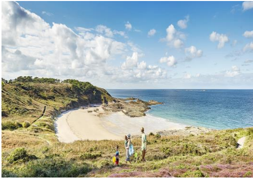
Plage à Erquy (500m du logement)

Ce stage s'adresse à tous ceux qui souhaitent découvrir ou approfondir leur connaissance de la voix.