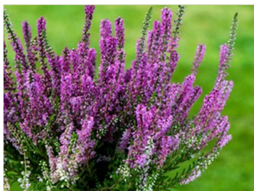
« Erica carnea » .

Mois de septembre pluvieux, an fructueux.