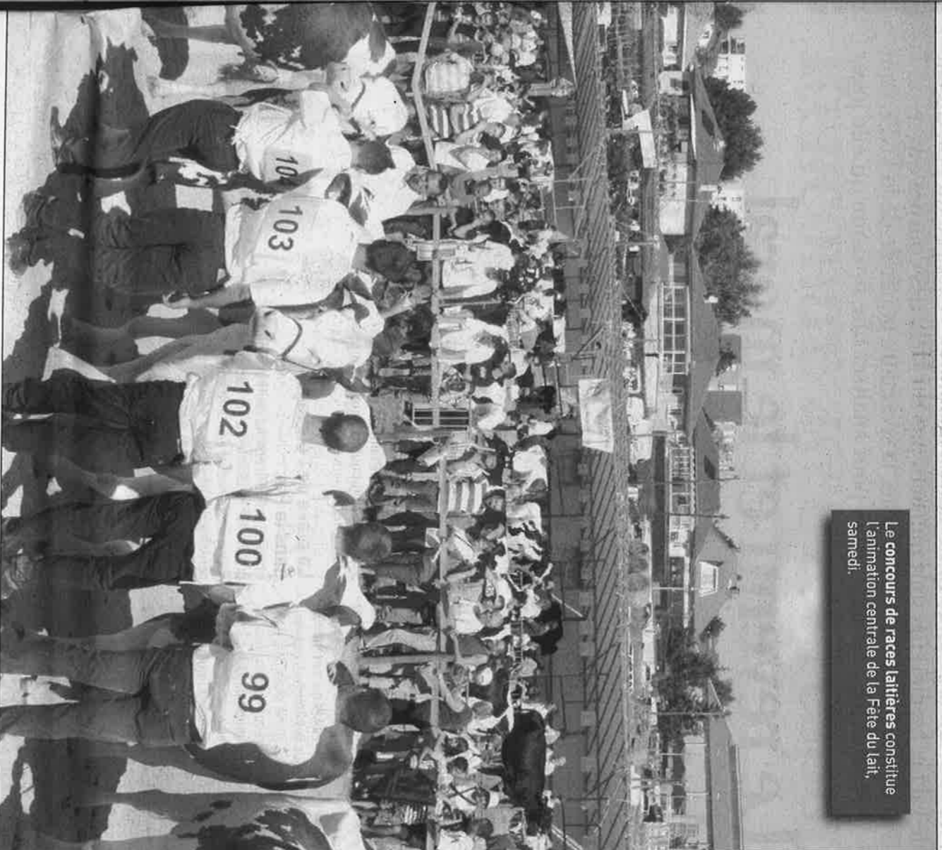
Le concours de races laitières constitue l'animation centrale de la Fête du lait, samedi.