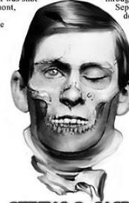
PHINEAS P. GAGE

"This is the bar that was shot at Cavendish, Vermont, from the injury & through the head of Mr. Phineas P. Gage Sept. 13, 1848. He fully recovered from the injury & deposited this bar in the Museum of the Medical College of Harvard University."