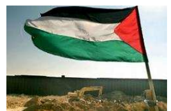
Le drapeau palestinien

Le Hamas attend les résultats des élections israéliennes pour savoir si une trêve va pouvoir se faire avec Israël. Benjamin Nétayahou, Tzipi Livni et Avigdor Lieberman étaient les principaux candidats des élections législatives. Mercredi 10 Février a eu lieu le dépouillement des votes. Tzipi Livni a gagné de très peu ces élections. Cette courte victoire entraîne un blocage politique pour la formation d'un nouveau gouvernement.