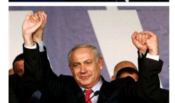
T. Livni et B. Nétayahou