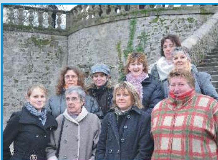
Une partie de l'équipe des intervenantes de l'Association Aide aux Seniors