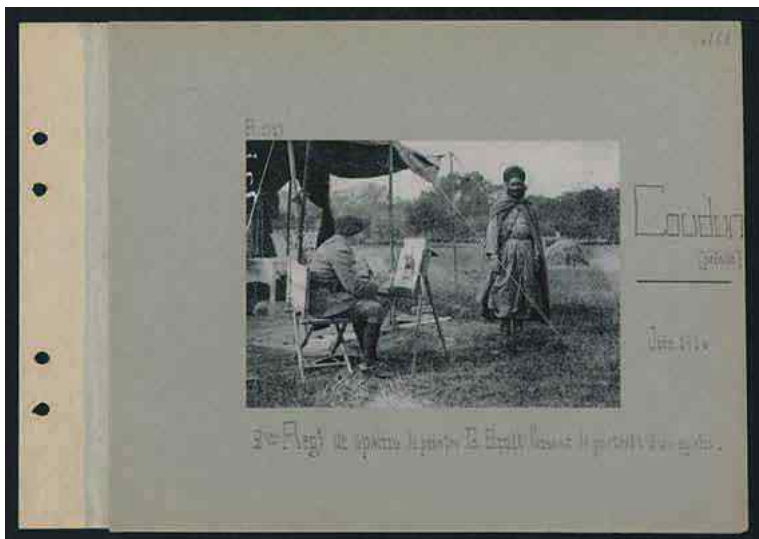
Le peintre Georges Scott faisant le portrait d'un spahi en juillet 1916. Cette photo est visible au 3 e étage dans l'exposition. Nanterre, BDIC.

gravure un travail de mise en scène, de retrait et d'ajout dans une volonté de dramatisation auquel contribue aussi ici la légende de la gravure Andrinople. – L'île de la mort. Prisonniers turcs parqués dans une île sur la Toundja, où ils sont condamnés à mourir de faim ou du choléra – L'écorce des arbres a été leur seule nourriture . Ses dessins, gravures et tableaux revêtent souvent une dimension tragique qui dépasse la simple illustration. Il n'hésite pas à représenter les sujets les plus dramatiques, y compris des cadavres, contrairement à ses dessins pendant la Grande Guerre. Il publie dans L'illustration des dessins qui doivent, selon la revue, contribuer à la renaissance du genre de la peinture militaire en lui conférant à nouveau une valeur de témoignage objectif [photographique], enregistreur exact, mais un peu trop machinal, souvent, des brutales réalités (L'illustration, 22 mars 1913). Nombre des dessins de Scott sont par ailleurs mis en vente, sous forme de gravures ou de cartes postales.