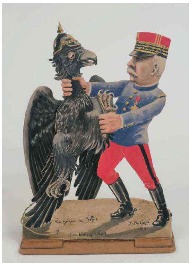
Document 2 : F. Philippi. La poigne de Joffre , 1914 . Mobile en carton. Crayon, gouache, aquarelle. H. 21,3 ; L. 15 ; P. 5 cm. Nanterre, BDIC. Inv. OBJ 779

La figure du chef fait l'objet d'une diffusion massive dans chaque camp, sur des supports variés, de la peinture à la presse en passant par la vaisselle patriotique et les objets comme dans les deux représentations du maréchal Joffre conservées à la BDIC ci-après.