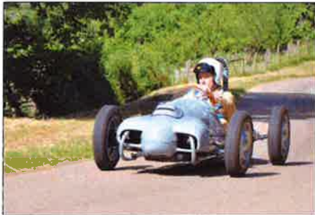
L'évocation du Racer DB Panhard, entièrement réalisée par Claude Chaume.

Courcelles-Val-d'Esnoms a renoué en ce week-end de la Pentecôte avec sa célèbre course de côte mais sous la forme d'une démonstration. L'Amicale des collectionneurs de véhicules anciens (ACVA) a offert la possibilité de voir rouler des véhicules du patrimoine automobile.