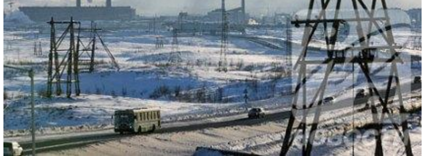
Document 1 : Vue général de Norilsk

Doc 3 : [Le] géant Norilsk Nickel [...] est spécialisé dans l'exploitation et la transformation du nickel et du palladium dans la région de Norilsk. Il produit également de l'or, du platine, du cuivre (3%) et du cobalt (10%). Norilsk Nickel est de loin le premier producteur mondial du nickel (20%) et du palladium (75%), et le principal producteur d'or de la Russie.