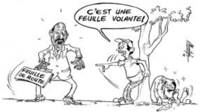
30/06/11 – La Gazette - La signature de la feuille de route interviendrait à Madagascar fin juillet. Le calendrier des rendez-vous préalables est confirmé : 6 juillet pour la réunion du GIC, 7 juillet pour la réunion du Conseil de Paix et de Sécurité, puis présentation aux Nations Unies, à New York, une semaine plus tard, pour solliciter un appui logistique et financier à la mise en œuvre de la feuille de route. Le document doit donc encore franchir plusieurs étapes avant son adoption définitive.