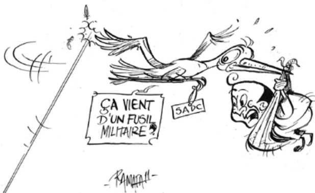
17/06/11 – Les Nouvelles – Marc Ravalomanana, que la Sadc souhaite voir rentrer au pays, est attendu de pied ferme par l'armée. La Sadc lui a refusé l'assistance militaire qu'il avait sollicitée pour sa protection.