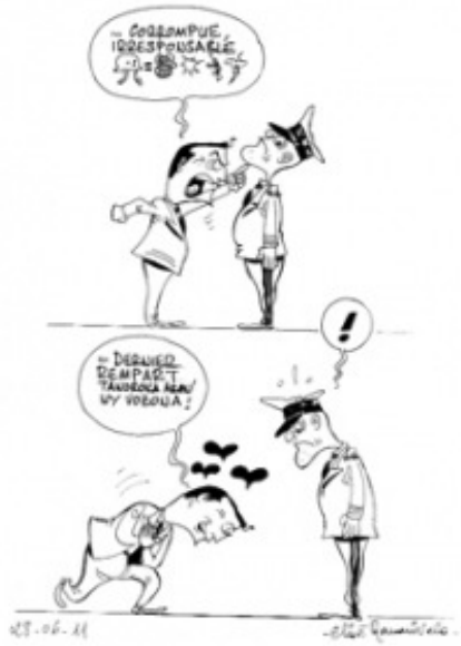
30/06/11 – L'Express – Une armée à la fois vilipendée et objet de toutes les tentatives de séduction de la part de Marc Ravalomanana