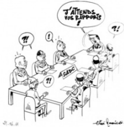
21/06/11 – L'Express – Marc Ravalomanana est supposé avoir encore une forte emprise sur les chefs d'Etat africains de la Sadc.