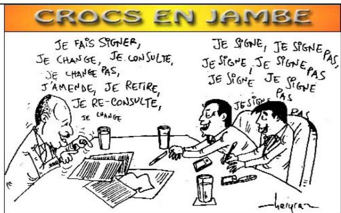
23/06/11 – Le Courrier - Retour de Leonardo Simão à Madagascar. « Plus question de négociations ou de remaniement de gouvernement ». Dès son arrivée il a tenu à préciser que l'amendement apporté par la Sadc à la feuille de route est définitif : c'est la position officielle de