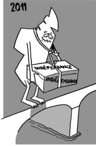
29/06/11 – Midi – 51 ème anniversaire de l'indépendance.