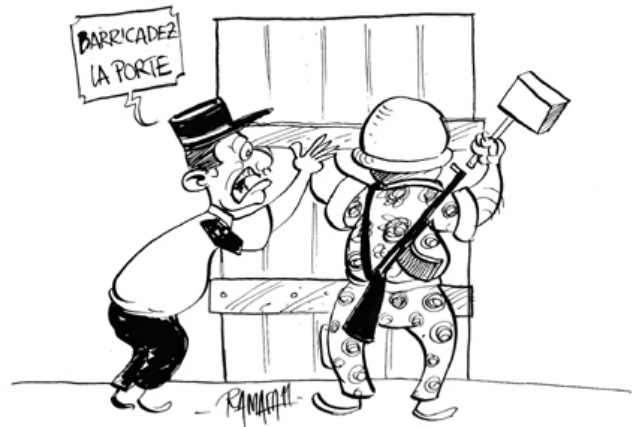
15/06/11 – Les Nouvelles - L'armée, la gendarmerie et la police sont opposées « dans l'immédiat » au retour dans le pays de l'ex-président, ont annoncé les commandants des trois corps de sécurité. « Les forces de l'ordre malgaches composées de l'armée, de la gendarmerie nationale et de la police nationale [...] s'opposent fermement au retour dans l'immédiat de Marc Ravalomanana pour préserver l'ordre et la sécurité publique », ont-ils déclaré devant la presse, révélant ainsi l'emprise des forces armées sur le régime, qui ne pourrait sans doute pas se maintenir sans leur soutien.