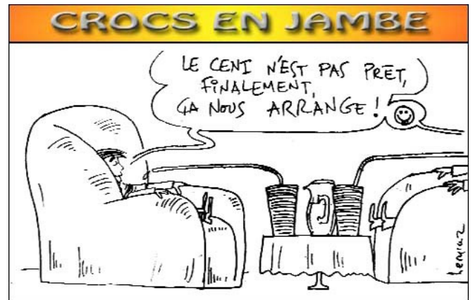
22/06/11 – Le Courrier - Pas de calendrier arrêté pour les élections. Le président de la HAT a expliqué qu'il n'est pas question d'annoncer un calendrier électoral avant que tout ne soit prêt. Il entend par cela que les préparatifs ne sont pas satisfaisants et qu'il faut disposer d'une liste électorale infaillible et d'une méthode conforme aux normes requises pour des élections véritablement démocratiques et transparentes, afin éviter les critiques et contestations de la communauté internationale. « Quand tout sera prêt et au point, nous inviterons la communauté internationale à apprécier. Et nous déciderons de la date et du genre de scrutin à entreprendre en toute indépendance car seul le peuple souverain peut imposer ces élections et non personne d'autre » a-t-il signifié.