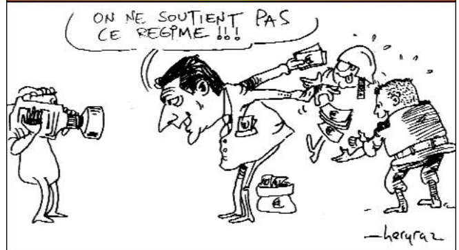
18/06/11 – Le Courrier – Le double jeu supposé de la France et de son ambassadeur. 9 milliards d'ariary par an, tel est la somme consacrée annuellement par la France dans le cadre de la coopération militaire. Ce chiffre a été rappelé par l'attaché de sécurité intérieure près de l'ambassade de France à l'occasion de la traditionnelle cérémonie de remise de décorations franco-malagasy. Des véhicules militaires livrés quelques jours auparavant par la France ont été exhibés lors du défilé militaire. La France et la Chine sont les deux fournisseurs de l'armée malgache.