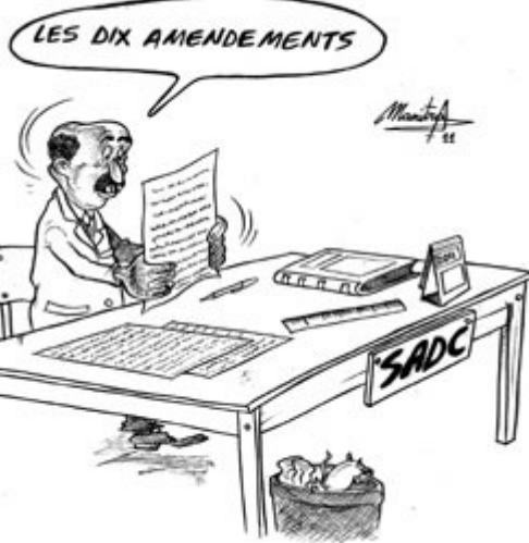
22/06/11 – La Gazette - La Sadc fait machine arrière et sème la confusion. Le retour de Marc Ravalomanana, annoncé initialement sans condition, est finalement suspendu à la réalisation de certaines conditions, laissées à l'appréciation du pouvoir de Transition. C'est ce qui ressort du nouvel amendement (article 20) apporté à la feuille de route. Celui qui figurait dans la résolution du Sommet de la Sadc à Sandton le 11 juin a été reformulé postérieurement dans un sens plus favorable à la HAT.