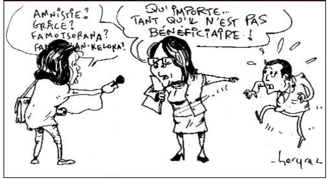
29/06/11 – Le Courier – Les déclarations de la ministre de la Justice apportent des clarifications au discours ambigu d'Andry Rajoelina concernant les mesures de grâce ou d'amnistie. Cette dernière nécessite le vote d'une loi par le Parlement, elle n'est pas de la compétence du président de la HAT. Mais quelque soit la formule juridique, Marc Ravalomanana sera exclu de ces mesures pour sa condamnation dans l'affaire de la tuerie du 7 février 2009 !