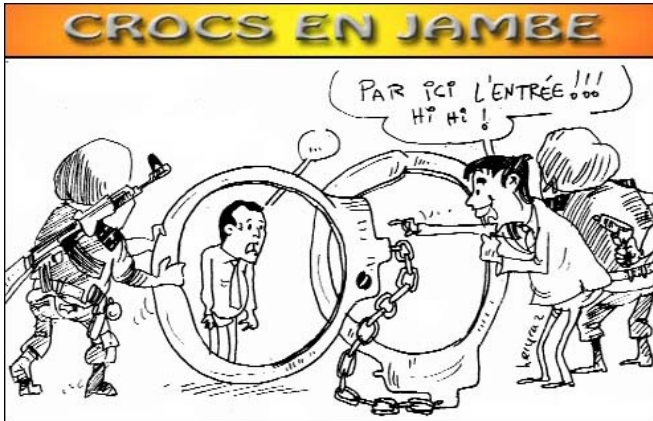
15/06/11 – Le Courrier - Retour de Marc Ravalomanana : Andry Rajoelina s'y oppose.