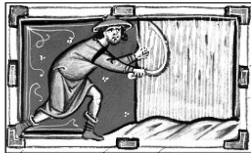
↑ Jehan le vilain

Jehan le vilain, un paysan libre, va cultiver certaines plantes dans ses champs. Avec les graines de ces plantes, le meunier va fabriquer de la farine, dont Thibaut a besoin.