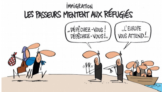
Dessin de Mix & Remix (Suisse)