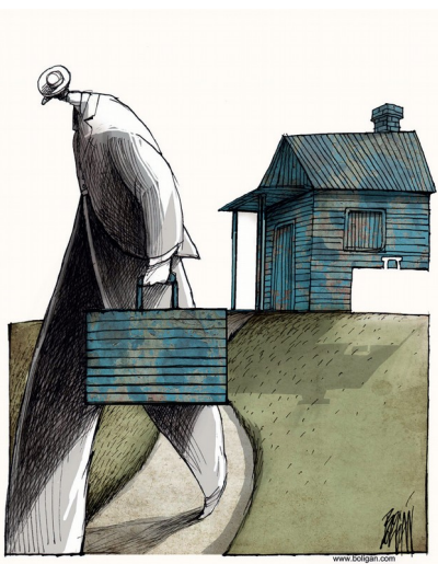
Dessin de Boligán (Mexique)