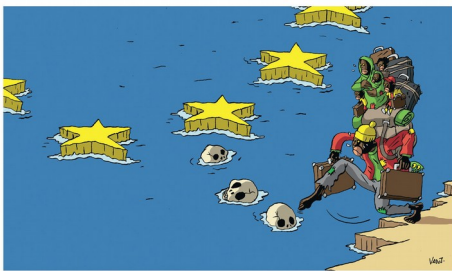
Dessin de Vadot (Belgique)