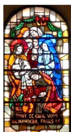
Église St Dominique Paris 14