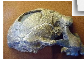
crâne fossilisé d'un Homo Erectus

Homo Erectus , qui signifie Homme debout à succédé à Homo Habilis il y a environ 1,8 millions d'années . Le squelette du plus ancien Homo Erectus a été trouvé au Kenya en Afrique de l'Est. Cependant on sait qu'Homo Erectus s'est installé sur 3 continents : l'Afrique, l'Asie et l'Europe .