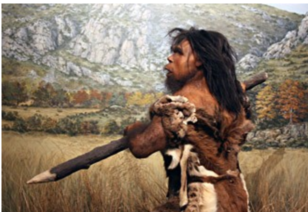
reproduction de l'homme de Tautavel

La grotte de Tautavel en France contenait les restes humains les plus anciens découverts à ce jour en Europe. L'homme de Tautavel (du nom de cette grotte) vivait il y a 450 000 ans . Il mesurait environ 1 mètre 60. Il marchait debout la tête bien haute. Il parlait sans doute .