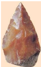
Pierre taillée en biface

Avec le temps, les Homo Erectus ont inventé de nouveaux outils. Ils ont notamment inventé le biface , un outil tranchant taillé dans un galet. Taillé en forme de pointe sur les deux faces, le biface était plus efficace que le simple silex pour percer et couper . Il pouvait aussi utiliser des lances .