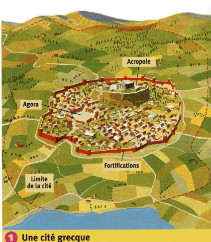
1 Une cité grecque