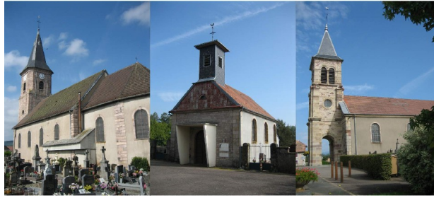
Lachapelle sous Chaux et Sermamagny (St Vincent) - Errevet (St Lin) - Evette-Salbert (St Claude)