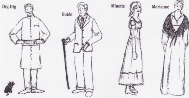
Croquis de costumes (Anne-Céline Hardouin) pour La Chatte métamorphosée en femme , mise en scène : Jean-Michel Fourmureau.