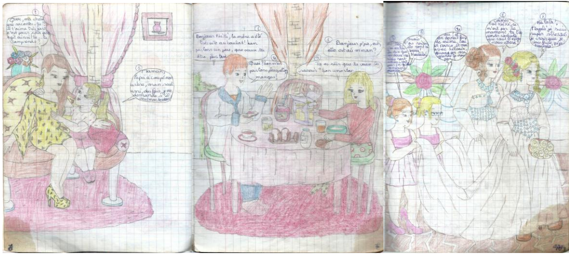
“ Crime d’Amour ” : 142 pages