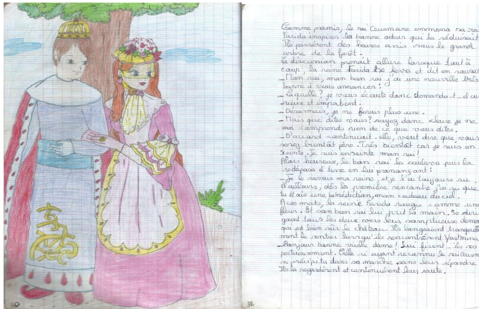
“ Le miroir de la haine ” : 182 pages