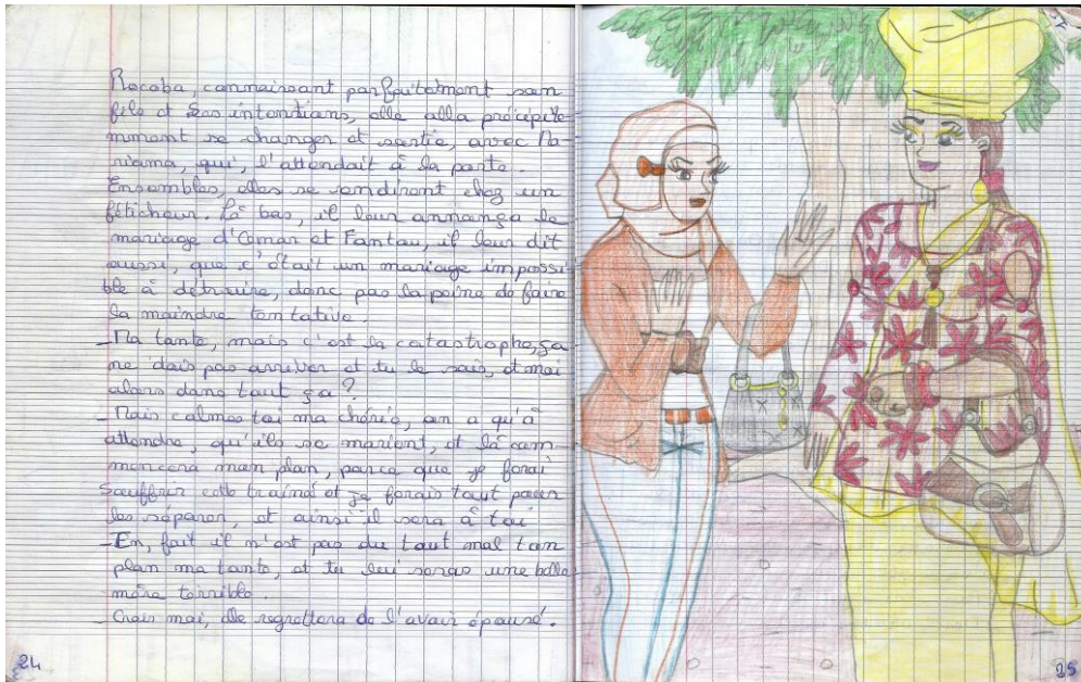
“ Fatou et sa belle-mère ” : 192 pages