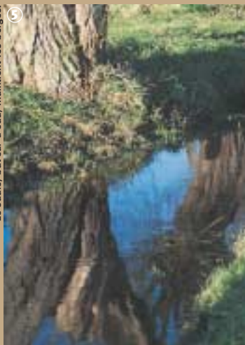
Le saule, buveur d'eau, maintient les berges.

me, le Grand Marais présente un grand intérêt écologique. Si la roselière domine le paysage, le roseau sert justement d'abris à quantité d'espèces animales particulièrement les oiseaux : le blongios nain, la rousserole effarvate, la locustelle tachetée ou la gorgebleue y trouvent matériel – pour construire leur nid – et nourriture pour festin royal. Protégées de la pollution et des excès d'engrais, de belles espèces florales garnissent le Marais du Val de Vergne : la gesse des marais, le myosotis des marais, le pigamon jaune, l'orchis négligé forment un joli bouquet, que se plaît à admirer la charmante grenouille verte, lorsqu'elle prend, de temps en temps, le soleil au bord de la rive. Même si de nombreuses prairies humides et roselières sont transformées en étangs voués à la promenade et à la pêche, elles n'en demeurent pas moins des espaces qui respirent la vie et où il fait bon se ressourcer.