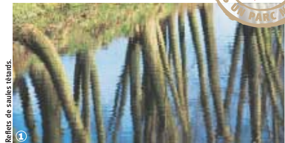
Reflets de saules têtards.

Randonnée Pédestre Circuit du Grand Marais : 4,3 km