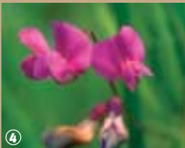
Gesse des marais.

Guy de Maupassant évoquait le marais comme un « monde différent qui a sa vie propre, ses habitants sédentaires et ses voyageurs de passage, ses voix, ses bruits et son mystère surtout » (Guy de Maupassant, « Amour », Le Horla). Le