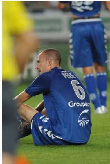
Pelé a déjà tiré la sonnette d'alarme sur le terrain. En coulisses, on flingue à tout va.