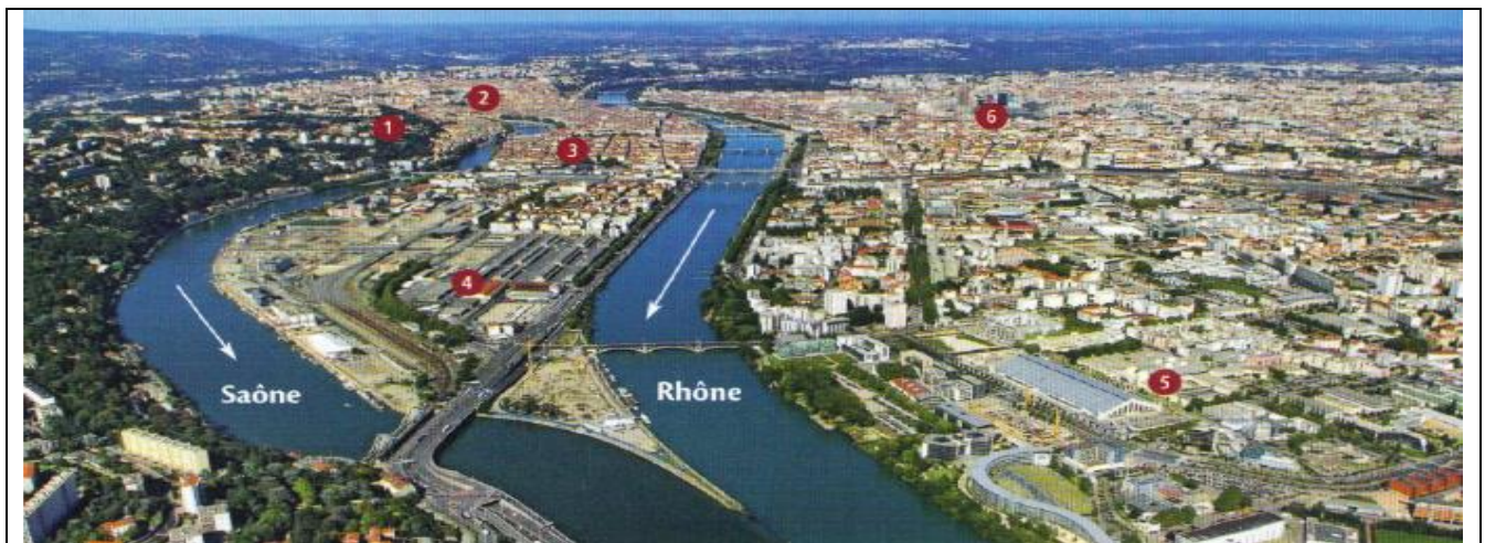
1 Fourvière 2 Croix-Rousse 3 Place Bellecour 4 Nouveau quartier Lyon Confluence 5 Gerland 6 La Part-Dieu