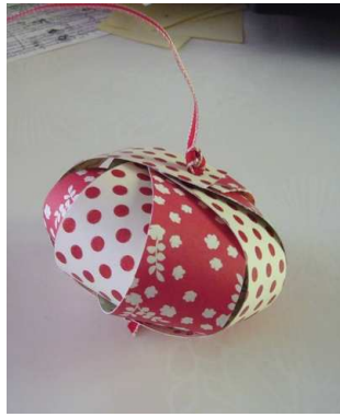
Boule de Noël