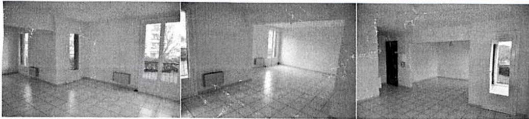
Salle de séjour - Salon

Prix du Loyer : 600 €/mois + charges 113,59 € (Syndic, entretien espaces verts, nettoyage cage d'escalier commune).