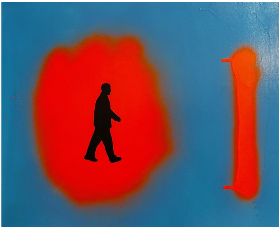
What next ? 2018, technique mixte, laque, aérosol acrylique, collage, sur toile 40 x 50 cm.