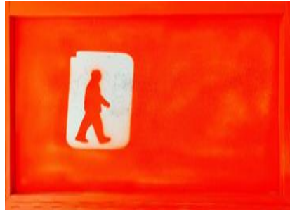
Au dos du tableau monochrome orange, 80 x 60 cm.

Un piéton « caché » au dos du tableau monochrome : le passant « de passage » - titre d'une dernière exposition à Charleroi en 2018 - est entouré de blanc, somme de toutes les couleurs. De la lumière, une visée supérieure. L'artiste est parti du magma, du chaos, de la matière première ; le piéton a surgi, il l'investit d'une dimension supérieure qui restera, celle de l'esprit.