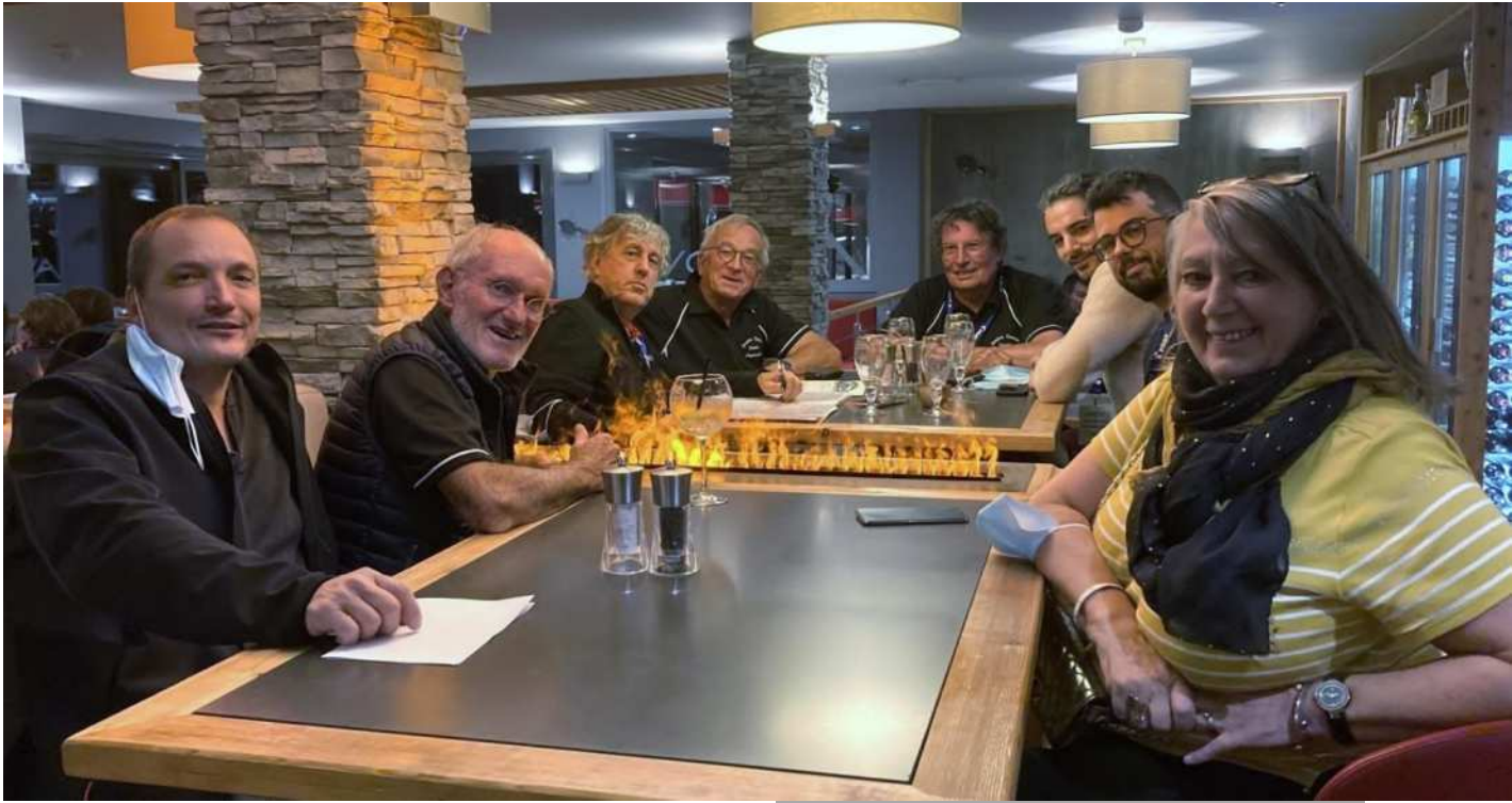
LA BELLE EQUIPE ..... au petit matin à MONTGENEVRE ... »

DERNIER ACTE : Le Retour sur Dijon avec halte en Ardèche : une transversale de plus.