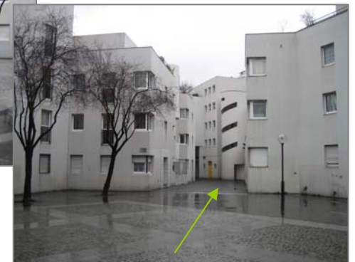
Accès au passage Duris

L'espace apparaît vaste, morne et peu investi.