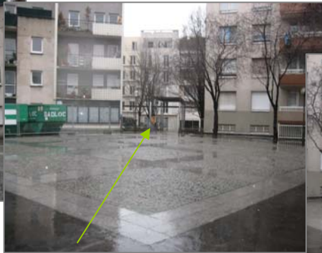
Pergola surmontant l'accès à la rue Houdart