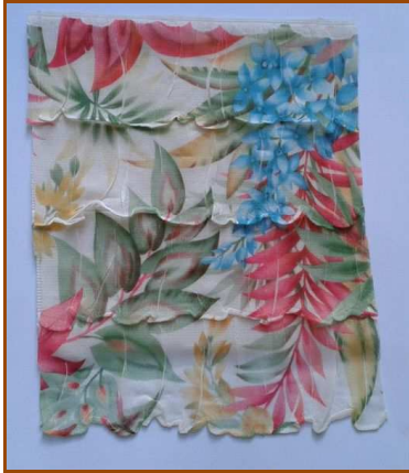
Endroit du tissu

Le tissu à volants est composé d'une épaisseur de tissu de couleur unie sur laquelle sont collés (ou cousus) des bandes de volants sur toute la largeur :