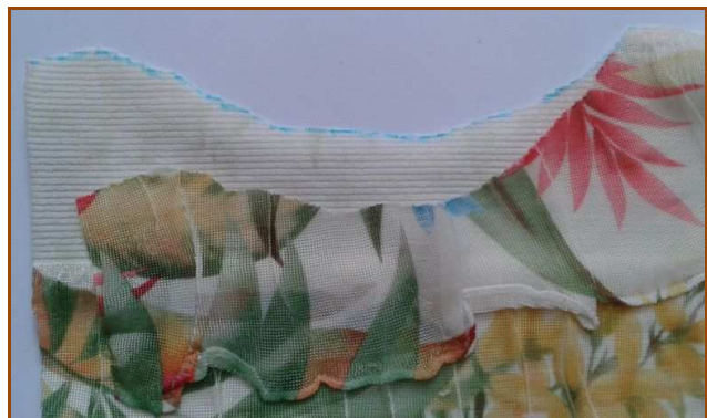
Endroit avec volant désolidarisé