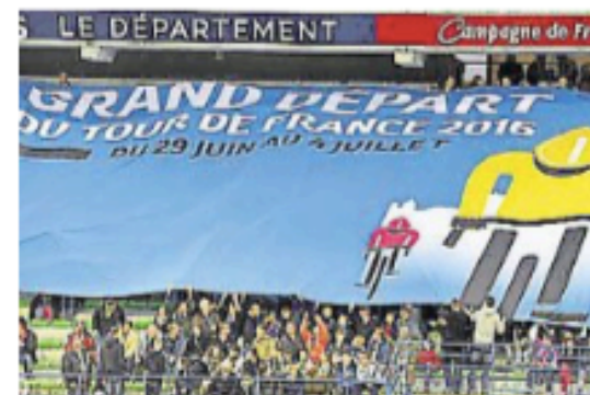
Hier, avant le match Caen-Nantes, le stade Malherbe aux couleurs du Tour.

Le budget du Grand départ du Tour de France 2016 a été présenté hier soir au stade Malherbe de Caen. Les retombées attendues sont très importantes. Le détail en chiffres.