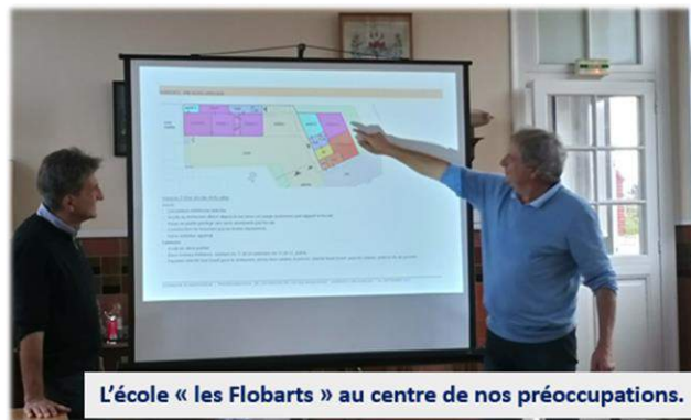
L'école « les Flobarts » au centre de nos préoccupations.

L'inscription pour la cantine ou la garderie est à déposer à 8h45 la veille du jour souhaité.