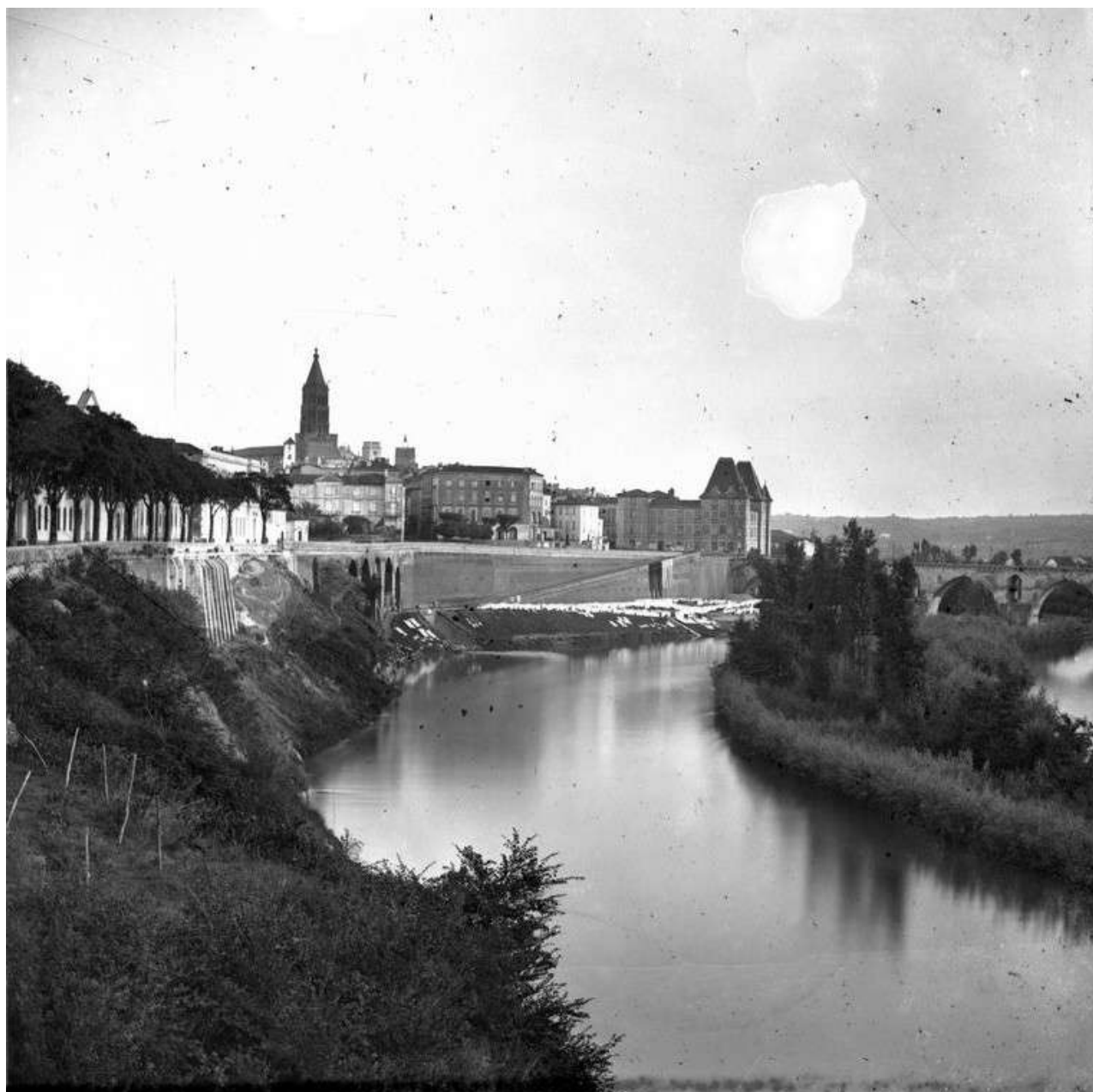
Cette fois c'était le 5 novembre 1861