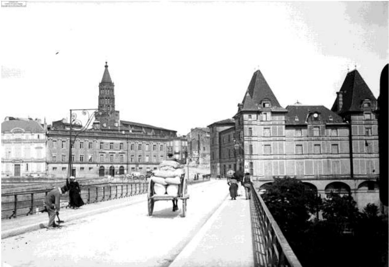
Le 16 juin 1899 : les bords du Tarn et le pont.